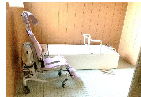
寝たきりでの入れる特殊浴槽