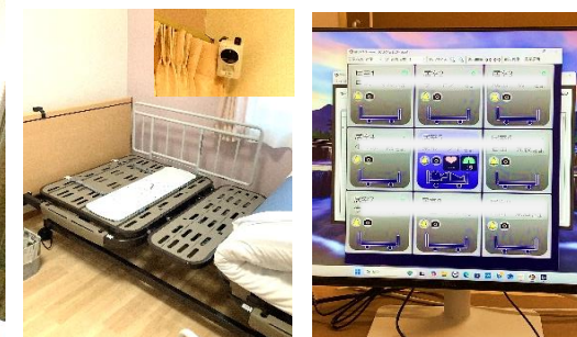
心拍・呼吸数、覚醒、起上り、離床がタイムリーに見守りできる機器

令和6年12月1日グループホームりんご座2ユニット目が開設となりました。弘前総鎮守弘前八幡宮様にご協力を頂き、竣工式開設記念式典を執り行いました。厳かな雰囲気の中、開設にあたりご尽力された工事関係者方々と共に、職員も緊張し出席しました。りんご座の基本理念である、住み慣れた場所でお互いを尊重し、共に支えあい安心した暮らしを送れるよう職員が専門性を持ってケアをし、一人ひとりの「私だけの人生」を大切にしたいだけのご支援いたします。また、ご家族様や地域の方々との交流の機会を多くし、地域の中に溶け込んでいくことを改め思い励んで参りますので、これからもよろしくお願いたします。